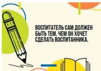
Рис. П2.2. Пример карточки с цитатой